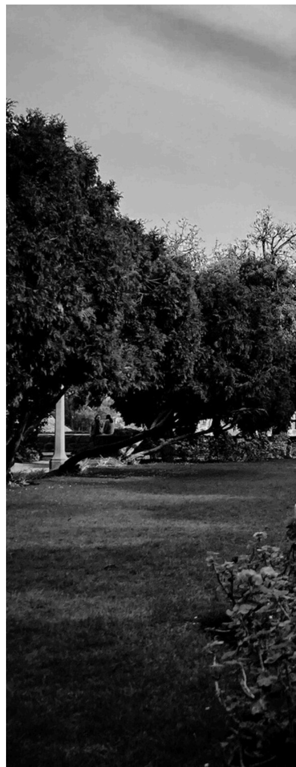
Resumen Beca Mantención por campus y sedes 2024